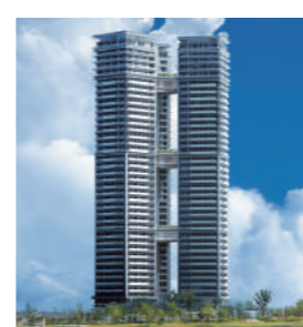
アイランドタワースカイクラブ (福岡市東区)